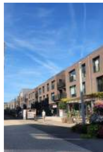
Promenade des Ours