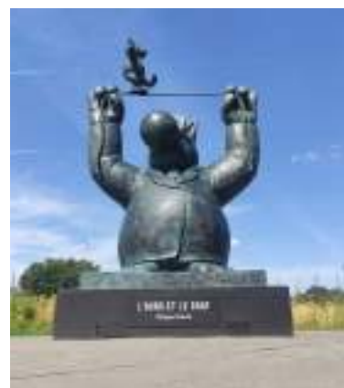
Sculpture « L'ours et Le Chat »