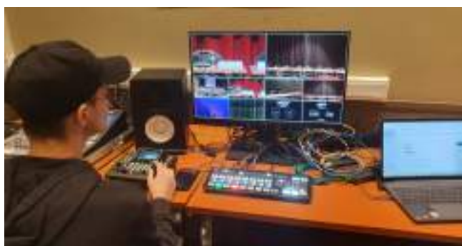
Retransmission en direct du Conseil communal