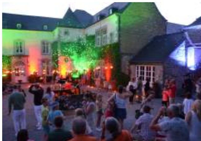
Nuit romantique à Thon-Samson