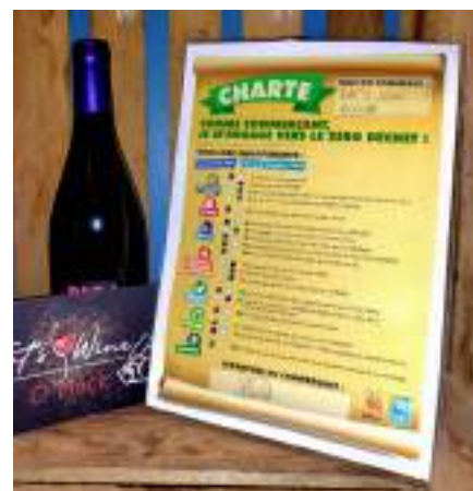
Charte « Zéro déchet » des commerçants

Des initiatives ont été prises avec la collaboration de nos commerçants : une dizaine de commerces affichent leur appartenance à une filière de « commerces zéro déchet ».