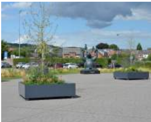
Esplanade des Ours, bacs fleuris et « L'ours et Le Chat »