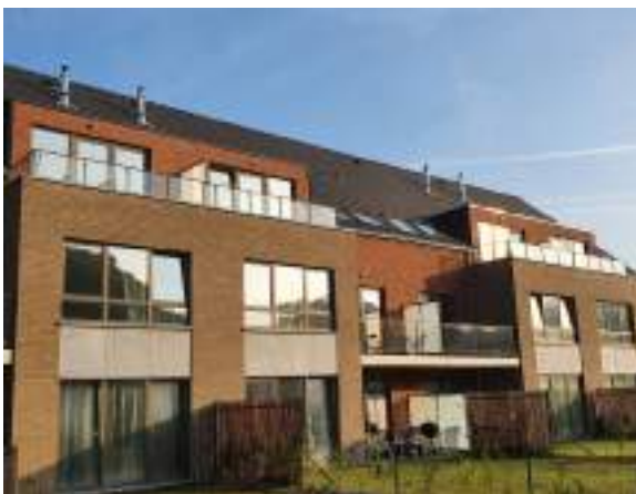
Namêche - Nouveaux logements