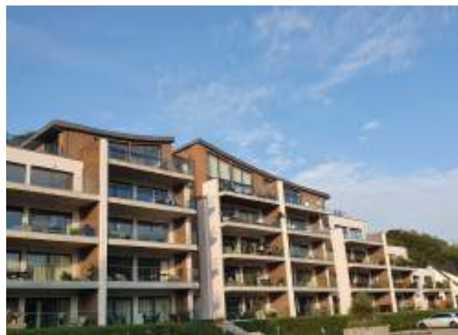
Maizeret - 30 nouveaux logements