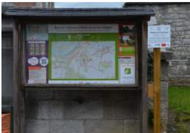
Réseau de balades balisées