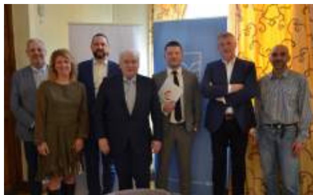
19 avril 2023 : signature officielle de la convention de reprise de l'EIC par WBE

En négociant avec WBE, Andenne conserve une école de promotion sociale en cœur de ville proposant des formations multiples et adaptées aux besoins des entreprises. L'équipe pédagogique et sa direction, de grande qualité, restent en place et continueront à transmettre leurs savoirs et savoir-faire avec les mêmes passions et motivations.