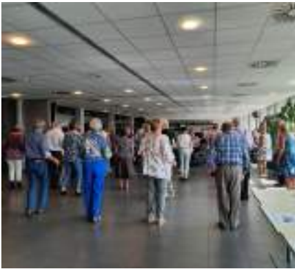
Thé dansant à l'Andenne Arena