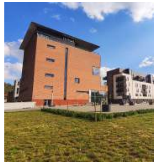
Le Phare, pôle touristique et culturel d'Andenne