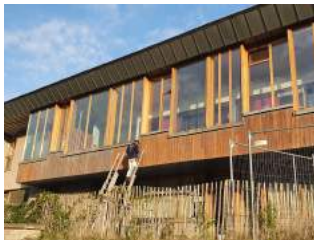
École communale de Namêche