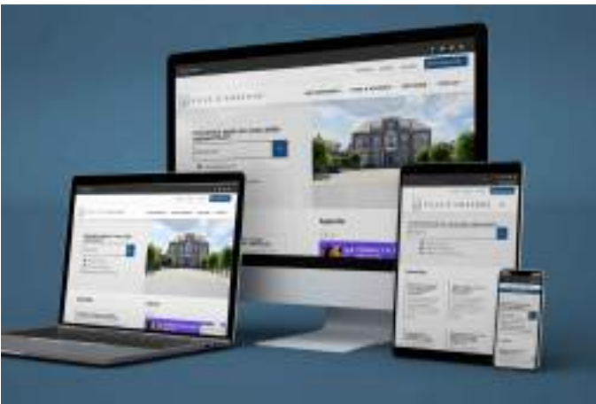
Site web de la Ville d'Andenne