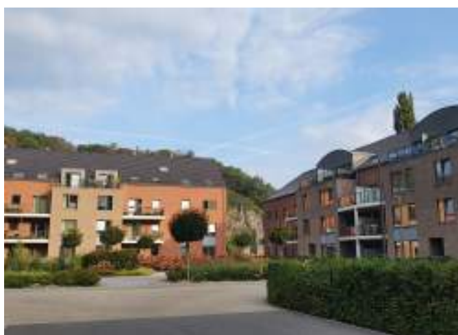
Sclayn - 48 nouveaux logements