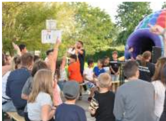
Fête de Quartier de la Maison de la Convivialité