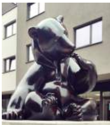
Sculpture « Le Miel n°3 »