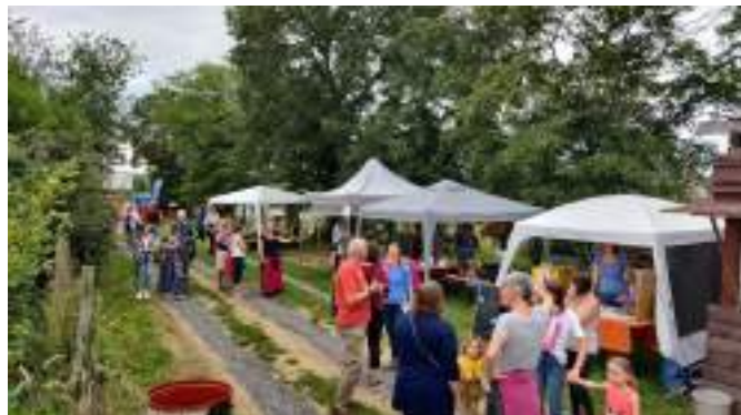
Marché « Les Halles des Ours » de Bonneville