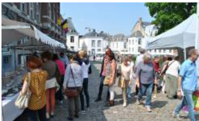
Ceramic Art Andenne