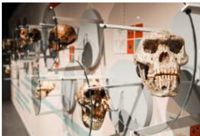
Espace Muséal d'Andenne - collections permanentes

En outre, les expositions temporaires proposées aux publics sont de grande qualité tant sur le plan muséal que pédagogique.