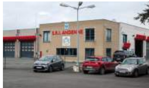
Caserne des Pompiers d'Andenne