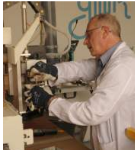
YourLab, le FabLab d'Andenne