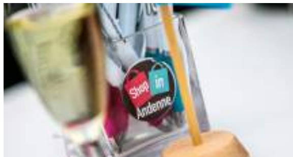
Shop in Andenne, structure de développement commercial