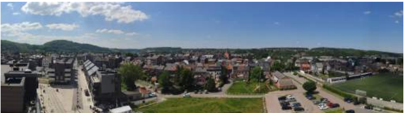
Vue de la terrasse du Phare