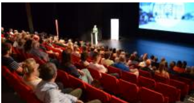
Réception des Nouveaux habitants