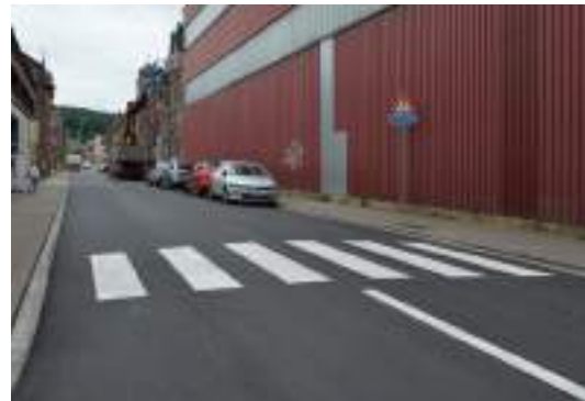
Rue Bertrand rénovée en mai 2024

En ce qui concerne les voiries communales, notons que la période du COVID a ralenti, voire complètement bloqué, plusieurs dossiers pendant près de 2 ans.