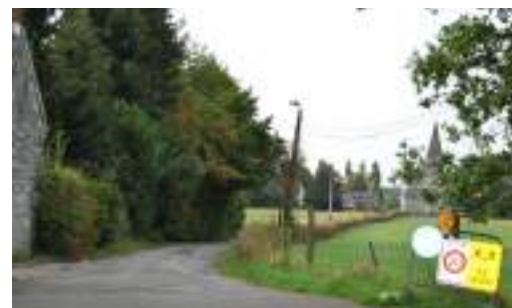
Zone provisoire « 30km/h »