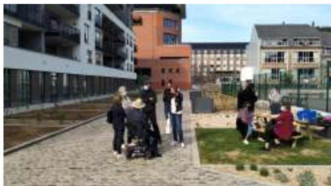
Inauguration des potagers partagés de la Promenade des Ours