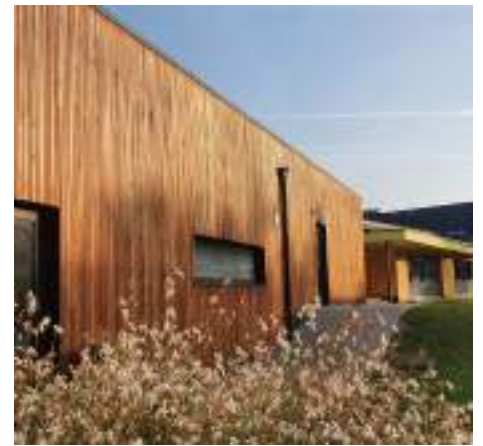
Salle « Les Falijes » à Namêche