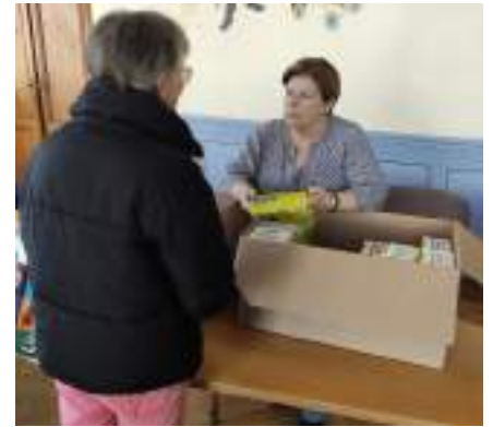
Distribution des boîtes jaunes par le CCAA