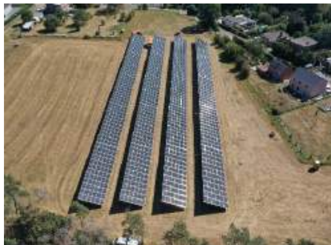
Champ photovoltaïque de l'AIEG