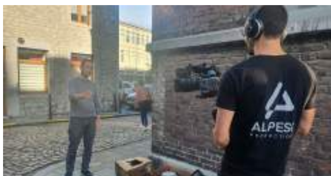
Tournage des vidéos de sensibilisation