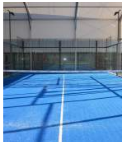
Deux nouveaux terrains de Padel