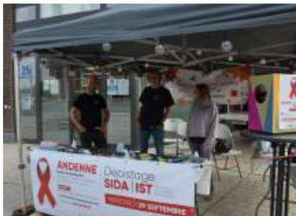
Stand de prévention des services de Cohésion sociale aux Fêtes de Wallonie