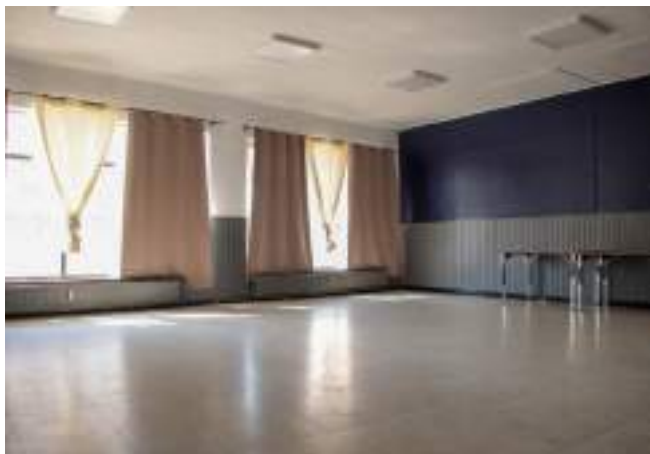
Salle communale de Seilles

La rénovation énergétique de la salle de Sclayn est à l'étude, avec pour objectif de déposer la demande de permis d'urbanisme dans le courant de l'été 2024. Les travaux seraient réalisés dans le cadre d'un subside UREBA.