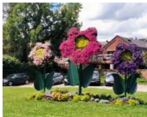
Fleurissement de la Ville d'Andenne