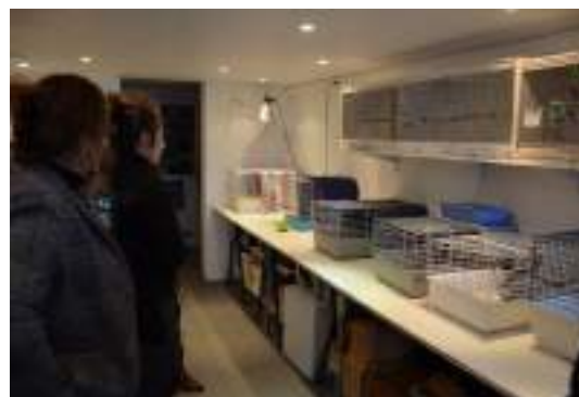
Infrastructures du Creaves