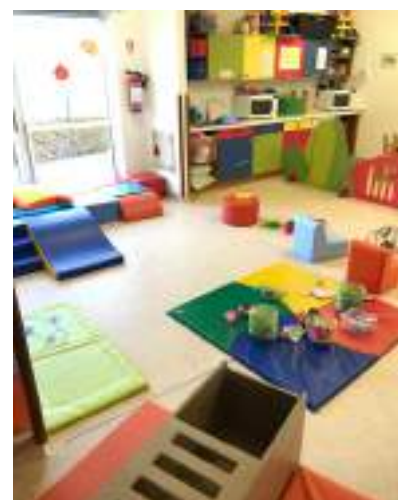
Crèche « Couleur Pastel » de Bonneville