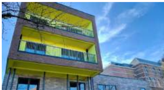
Résidence-service « Le Pré fleuri »