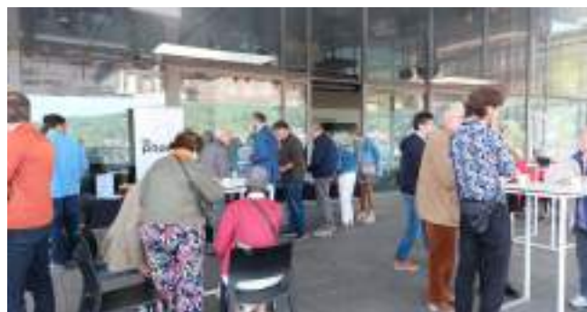
Fêtes des Voisins au Phare