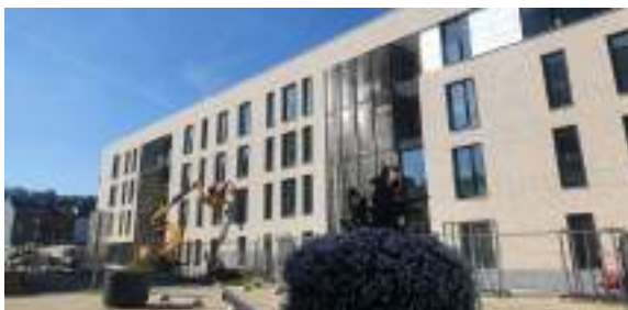
Logements rue Robert Mordant