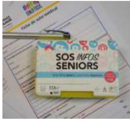
SOS Infos Seniors : la « boîte jaune »