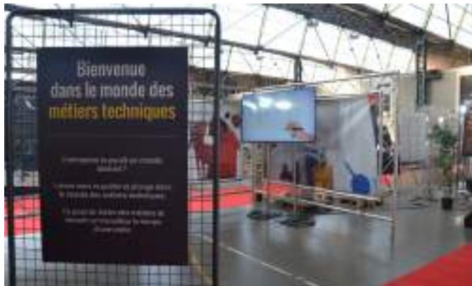
Festival des Métiers techniques - 2022