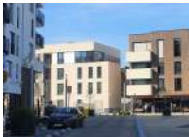
Revitalisation du centre-ville