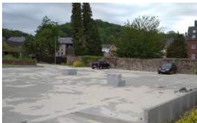
Parking de la rue Hanesse