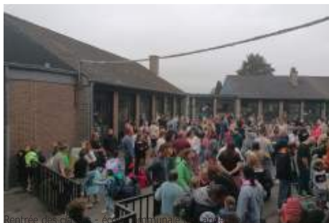
Rentrée des classes - école communale de Namêche