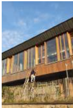
École de Namêche