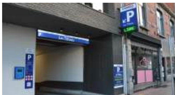
Entrée du parking souterrain « Les Tilleuls »