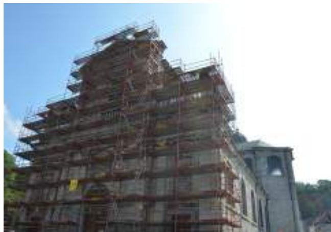
Restauration de la Collégiale Sainte-Begge