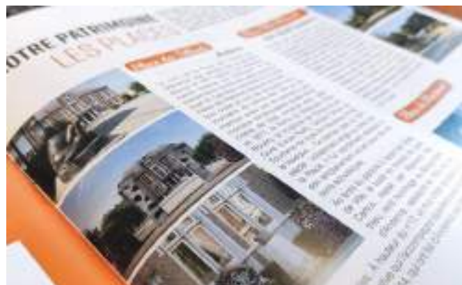
Bulletin communal de la Ville d'Andenne