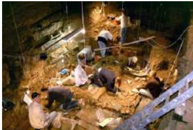
Grotte Scladina - fouilles