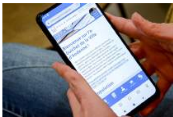
L'e-Guichet de la Ville d'Andenne est accessible depuis PC, tablette ou smartphone