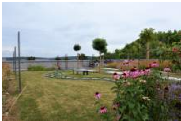
Cimetière vert de Namêche