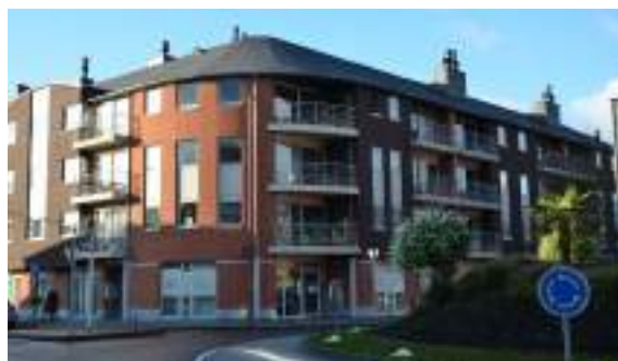
Maison de l'Emploi d'Andenne