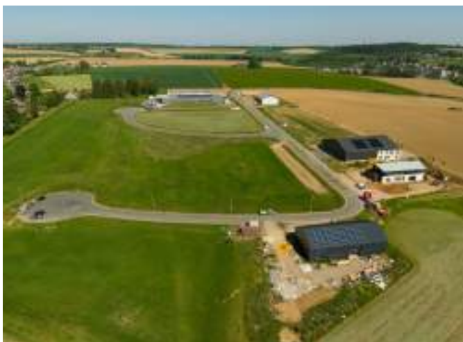
ZAE La Houssaie