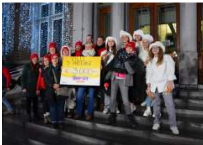
Défi des Trairies